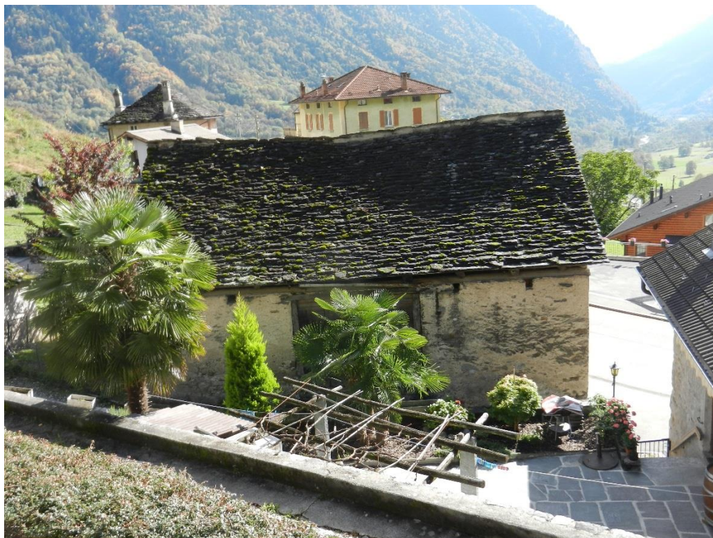
Vecchie stalle (piccole)